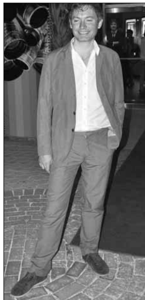
Kevin MacDonald (1967) werd in Schotland geboren en heeft meerdere documentaires en films op zijn naam staan.