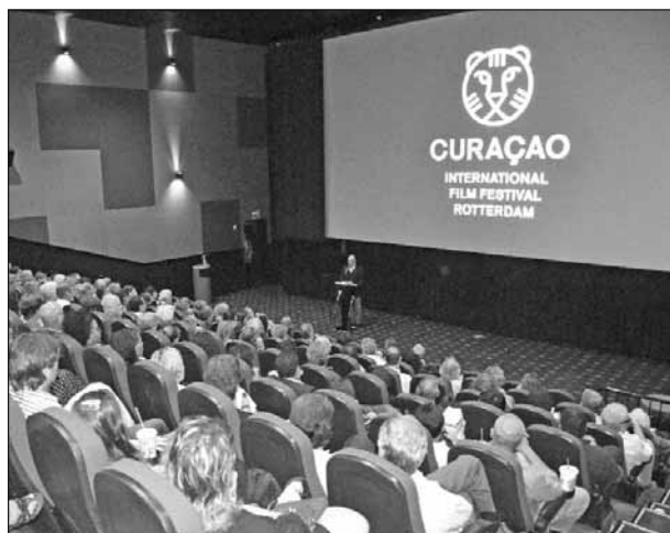
De zaal voor de openingsfilm van het festival was volledig uitverkocht.